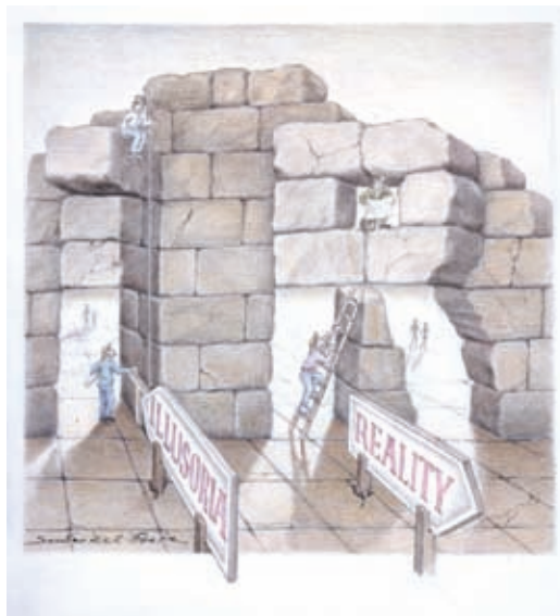
Zwischen Illusoria und Realität. © Sandro Del-Prete