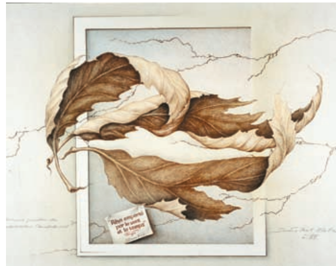
Geheimnis zwischen den Herbstblättern. © Sandro Del-Prete