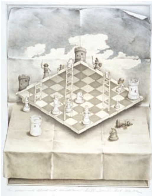
Das gekrümmte Schachbrett. © Sandro Del-Prete

MUSEUM UND GALERIE FÜR OPTISCHE TÄUSCHUNGEN UND HOLOGRAPHIEN