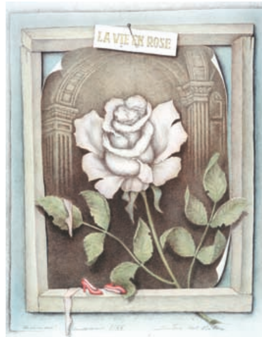
La Vie en Rose. © Sandro Del-Prete